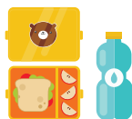
Ланч-бокс и бутылка для воды