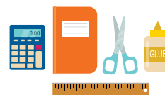
Калькулятор, блокноты, ножницы, клей и линейка